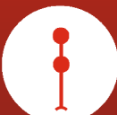
KUMITE AM BALL